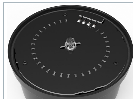
Źródło światła Futurled6-100mm zainstalowane w obudowie (NOWE)